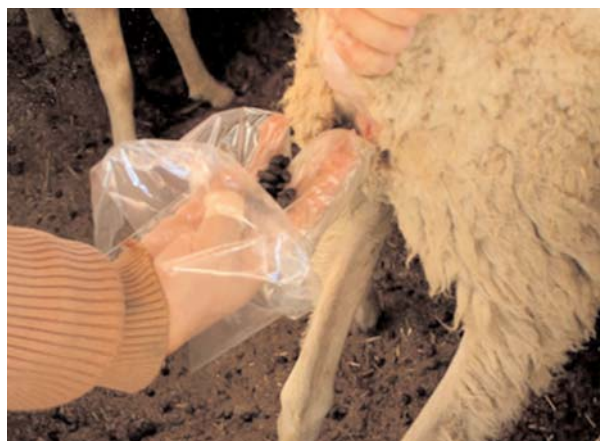
Las heces se recogen directamente del recto del animal.

La magnitud del fenómeno es tan importante que en algunas áreas de producción de Sudáfrica las resistencias a los antihelmínticos han provocado el abandono de la actividad ganadera a consecuencia de la falta de rentabilidad debida a las pérdidas producidas por los parásitos gastrointestinales.